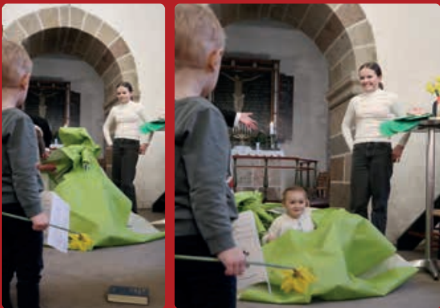
Byens største påskeæg fandt vi til spaghettigudstjenesten i foråret, hvor vi hørte om, hvordan Jesus påskemorgen brød dødens æggeskal i stykker.