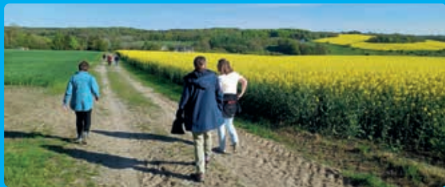
Det var en umådelig smuk dag, da vi i maj mødtes til vandregudstjenesten i Volsted sogn