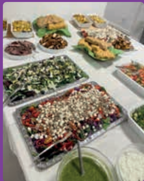
Skærtorsdag blev fejret med aftengudstjeneste og lækker, hjemmelavet middag efterfølgende