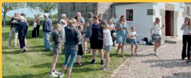
2. pinsedag var korene med til at gøre gudstjenesten ekstra festlig, og så var der selvfølgelig kirkekaffe på kirkegården efterfølgende.