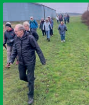
Påskevandring har gennem mange år været en fast tradition og folk kommer fra nær og fjern for at være med.